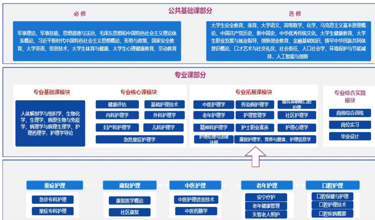
图 1 护理专业课程体系图

根据课程体系设计思路，对接人才培养规格要求，构建了模块化课程体系，护理专业课程设置主要包括公共基础课程和专业课程两部分，其中专业课程分为专业基础课程模块、专业核心课程模块、专业拓展课程模块（含特色护理方向课程）和专业综合实践模块。其中公共基础课程 25 门，专业基础课程 7 门，专业核心课程 7 门，专业综合实践课程 3 门，专业拓展课程 11 门，共计 53 门课程。课程体系如图 1 所示。