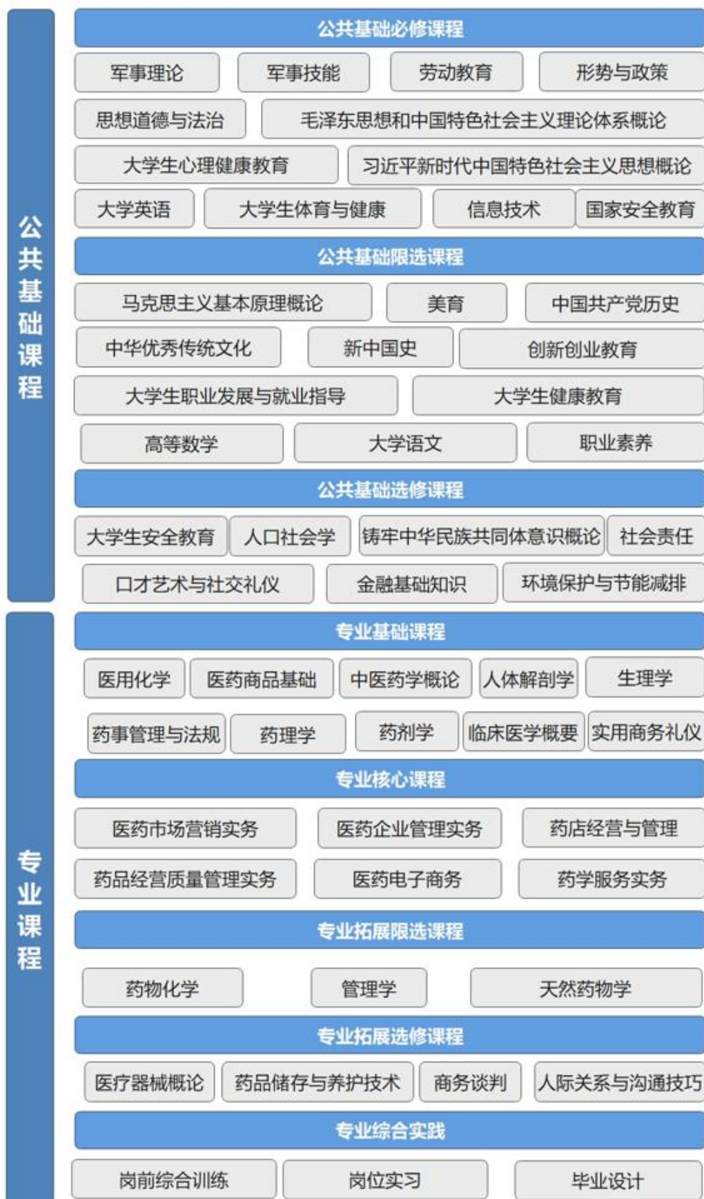
图 2 课程体系架构图