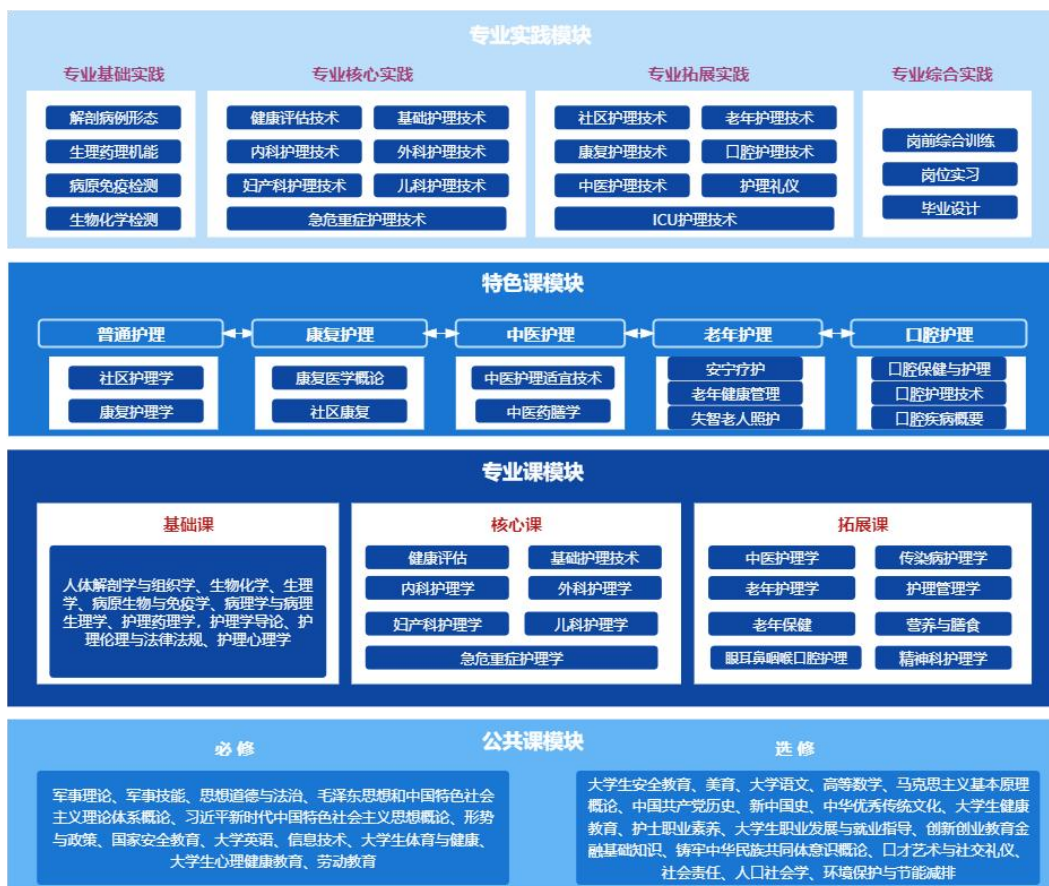
图 1 护理专业课程体系图