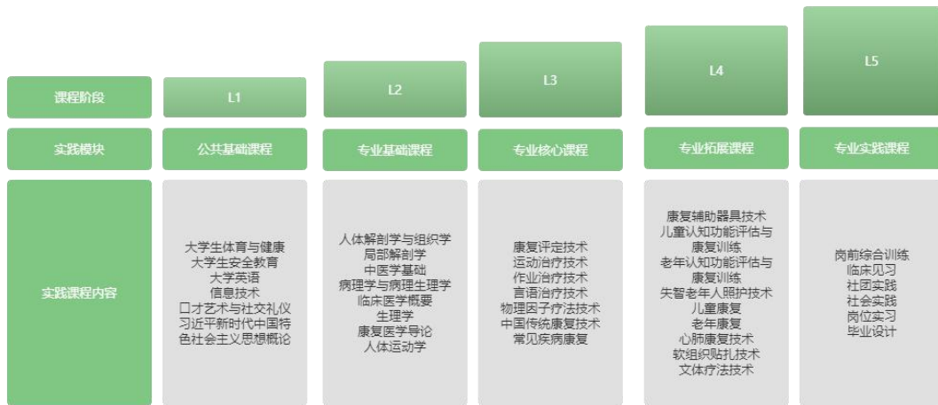
图 2 专业实践教学体系图

社会实践、岗位实习、毕业设计等。基本实验实训在校内实验实训室或相关协作医院完成；临床见习、社会实践在医院、社区及校外其他场地完成；跟岗实习在二级甲等及以上医院或相关康复医疗机构开展，严格执行《职业学校学生实习管理规定》和《高等职业学校康复治疗技术专业跟岗实习标准》，毕业设计通过岗位实习在实习医院由医院及校内老师指导完成，有利于提升学生就业、创业和创新能力，详见专业实践教学体系图 2。