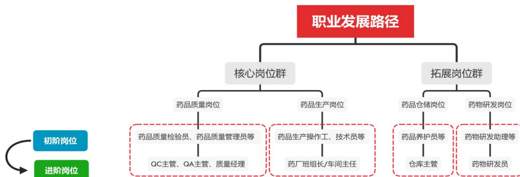
图 1 职业发展路径