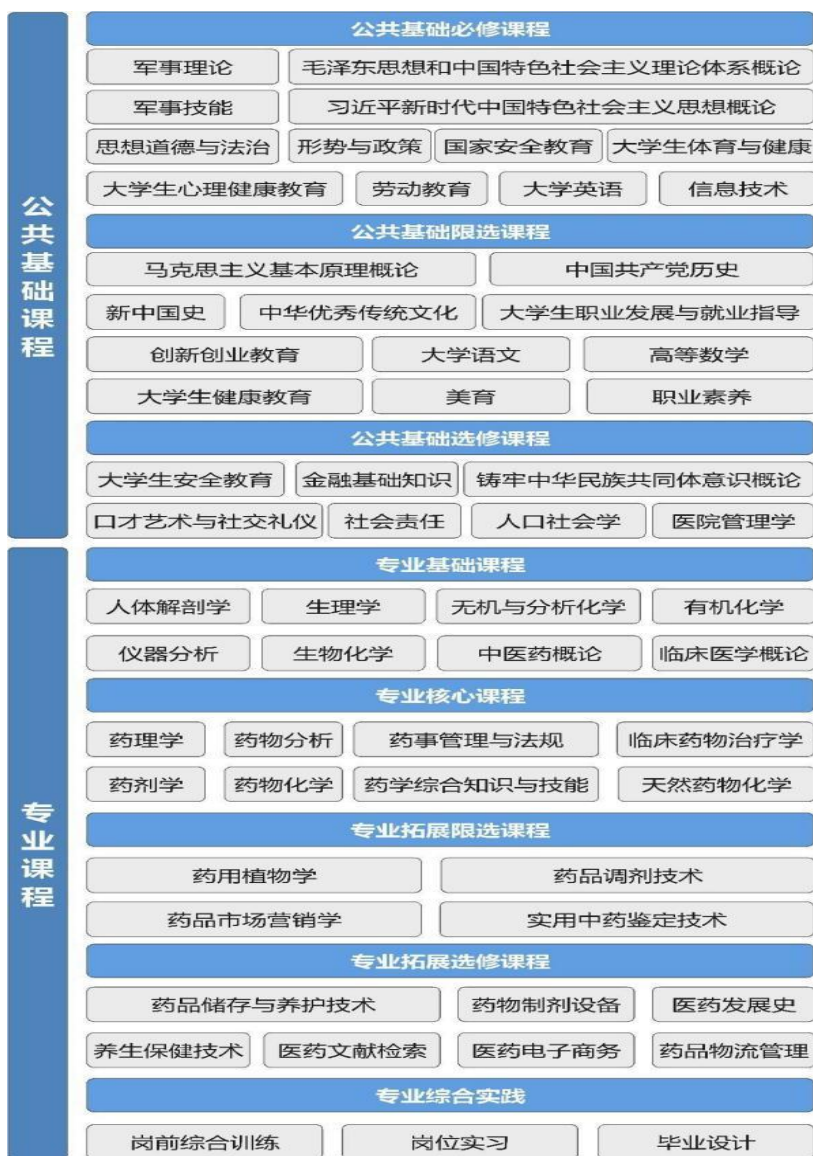
图2 课程体系架构图

通过调研湖南省医药产业链的各类典型企业、医疗机构，分析和归纳专业对应典型岗位的职业活动和能力素质要求，以培养职业行动能力和职业生涯可持续发展能力为目标，对接国际、国内职业岗位标准，构建专业课程体系。课程体系设置为两部分，公共基础课程用于提升学生思想政治、身心修养和科技人文素质，注重通过在线学习、讲座、参观体验、社会实践、社团辅导等生动的形式加强社会主义核心价值观和职业道德、劳动精神教育，加强心理健康和就业创业教育，促进学生健康成长和全面发展；专业课程用于培养学生专业基本能力、岗位核心能力和职业技能，并为学生职业拓展和个性化发展提供支持。