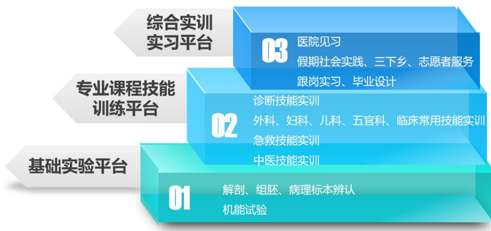
图 3：本专业实践教学体系架构图